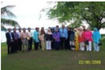
Peserta bergambar di Universiti Teknologi MARA (UiTM), Cawangan Sabah

Objektif lawatan adalah untuk memberi pendedahan dan dapat membuka minda serta menjana idea mengenai kemudahan, aktiviti dan perkhidmatan perpustakaan terkini, menjalinkan kerjasama dan perkongsian maklumat dengan perpustakaan lain dan untuk melihat kemudahan dan perkhidmatan perpustakaan lain bagi tujuan penambahbaikan perkhidmatan Perpustakaan UKM.