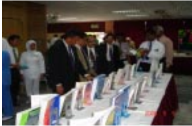
Melawat Pameran Buku-buku yang diserahkan oleh HUKM

Perpustakaan Hospital UKM telah diberi peruntukan sebanyak RM20,000.00 pada 2005 oleh Perpustakaan Induk UKM khusus untuk pembelian buku teks bidang klinikal dan ditempatkan di Pusat Sumber Hospital Teluk Intan. Justeru, Majlis Penyerahan buku ini akan membantu menambah koleksi Pusat Sumber Hospital Teluk Intan. Disamping itu pelajar-pelajar tahun lima, Fakulti Perubatan UKM juga dapat merujuk kepada buku-buku teks tersebut kerana jarak mereka di Teluk Intan menyukarkan mendapat bahan rujukan buku teks dari Perpustakaan HUKM. Sumbangan ini juga sebagai ucapan terima kasih di atas kerjasama Hospital Teluk Intan dari segi melatih pelajar-pelajar Fakulti Perubatan.