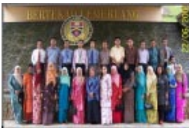
Peserta bergambar di Universiti Malaysia Sabah (UMS)

Perpustakaan HUKM telah menganjurkan satu lawatan sambil belajar ke Kota Kinabalu Sabah pada 21 – 24 Jun 2006. Lawatan sambil belajar ini telah dilakukan ke tiga buah institusi iaitu Universiti Malaysia Sabah (UMS), Perpustakaan Awam Negeri Sabah (PANS) & Universiti Teknologi MARA (UiTM) Cawangan Sabah. Seramai 21 orang peserta yang terdiri daripada 13 orang daripada kakitangan Perpustakaan HUKM, 4 orang kakitangan Perpustakaan Tun Seri Lanang dan 3 orang kakitangan Perpustakaan Dr Abdul Latiff, Kampus Kuala Lumpur telah mengikuti lawatan tersebut.