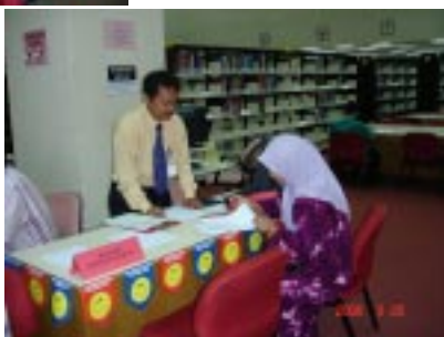
Pelanggan sedang memberikan cadangan di Kaunter Hari Mesra Pelanggan

Sambutan yang diberikan oleh pelanggan pada hari tersebut adalah baik dan terdapat pelanggan perpustakaan mencadangkan supaya program tersebut dapat diadakan pada masa-masa yang akan datang.