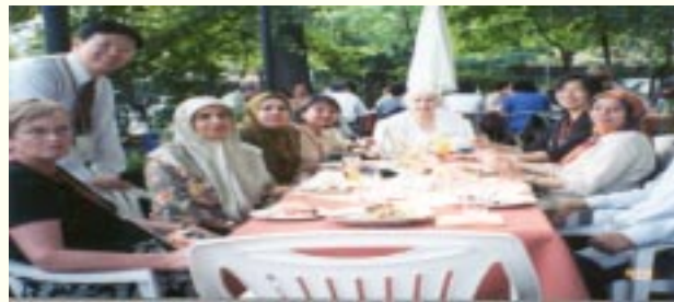
Para peserta Malaysia sedang meraikan ahli RSCAO yang baru di sebuah restoran Turki di Berlin