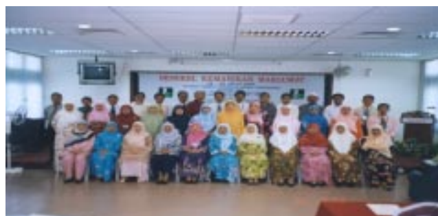
Peserta & Fasilitator Bengkel