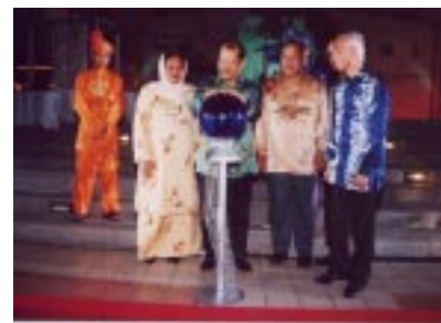
Acara Perasmian oleh YB Menteri Pendidikan