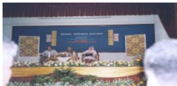
Majlis Perasmian oleh Y. Bhg Dato' Idris Jusoh