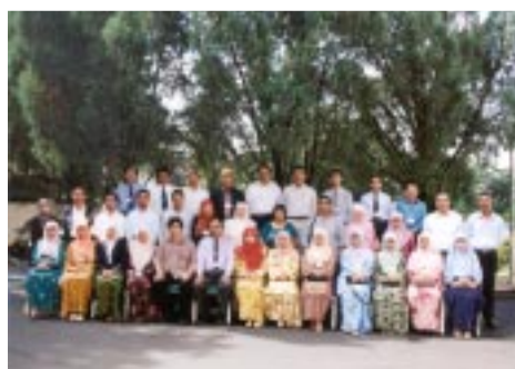
Para Peserta Kursus Pembantu Perpustakaan/ Pusat Maklumat

Secara keseluruhan, para peserta berpuas hati dengan kursus yang dijalankan dan mencadangkan agar Persatuan Pustakawan Malaysia menganjurkan kursus-kursus yang sebegini dan berkaitan dengan Pengkatalogan, Pengkelasan dan Khidmat Pelanggan pada masa hadapan.