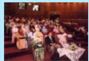
Para Peserta di Simposium PPM