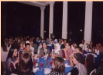
Para ahli PPM yang hadir pada majlis tersebut

PPM berhasrat akan meneruskan acara majlis makan malam ini pada setiap tahun. Tahniah kepada Jawatankuasa kecil Sosial PPM yang telah bertungkus lumus menganjurkan Majlis Makan Malam PPM 2004.