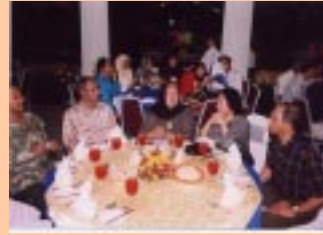
Antara ahli majlis PPM yang hadir pada Jamuan Makan Malam PPM

Mesyuarat Agung yang diadakan telah membentangkan laporan aktiviti dan penyata laporan kewangan PPM sepanjang tahun 2003. Selain itu, beberapa usul dan cadangan oleh ahli PPM telah dibincangkan pada mesyuarat Agung kali ini. Antaranya ialah cadangan agar PPM mengkaji pengujudan Akta Pustakawan bagi profesion kepustakawanan, dan cadangan kad keahlian Profesional untuk ahli Persatuan Pustakawan Malaysia (PPM).