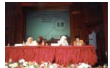
Mesyuarat Agung PPM bermula.