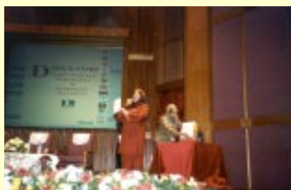
Majlis Pelancaran Direktori Perpustakaan Perubatan & Kesihatan Malaysia.

Direktori ini diterbitkan sebagai satu rujukan penting yang diperlukan dikalangan perpustakaan perubatan dan kesihatan diseluruh Malaysia bagi mengetahui kedudukan staf, koleksi dan perkhidmatan yang disediakan oleh perpustakaan berkenaan. Ia juga menjadi panduan kepada pustakawan, pengurus maklumat, kakitangan perpustakaan dan pembekal lain yang menjalinkan hubungan bagi meningkatkan perkhidmatan perpustakaan lain.