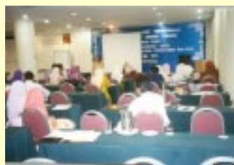
Penceramah sedang memberi komen aktiviti berkumpulan

Secara keseluruhan, bengkel ini telah memberi kesan kepada para pustakawan untuk menjalankan aktiviti dan tugas mereka di perpustakaan dengan mengikut lunas-lunas undang-undang Malaysia dan antarabangsa. Kebanyakan peserta mengharapkan pihak PPM dapat menganjurkan bengkel lanjutan berkenaan isu yang berkaitan undang-undang di perpustakaan.